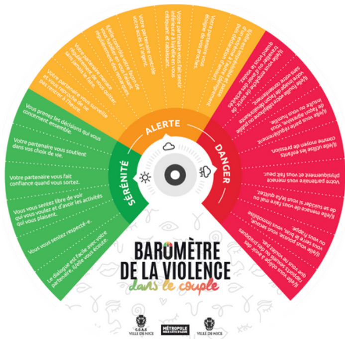
Projet PROSOL FEMMES

L'égalité entre les femmes et les hommes décrit une situation dans laquelle femmes et hommes jouissent de l'égalité des droits et des chances , où le comportement, les aspirations, les souhaits et les besoins des femmes et des hommes sont également valorisés et favorisés. Elle implique également d'assurer leur égalité dans l'accès aux ressources et dans la distribution des ressources . (Source : Conseil de l'Europe)