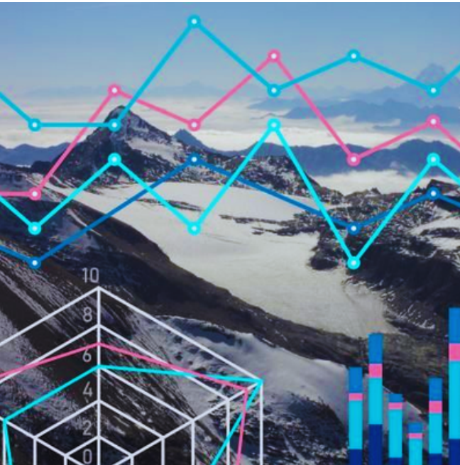
Projet Interreg Alcotra " Observ'Alp "

Le développement durable, tel que défini par l'ONU , est un modèle de développement qui répond aux besoins du présent sans compromettre la capacité des générations futures à répondre aux leurs, en équilibrant l'économie, le social et l'environnement. L'Union européenne l'intègre dans toutes ses politiques en promouvant une croissance verte et inclusive, la protection de la biodiversité et une transition vers une économie neutre en carbone.