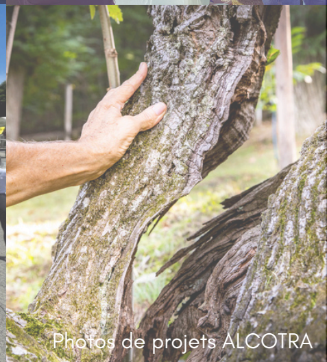
Photos de projets ALCOTRA