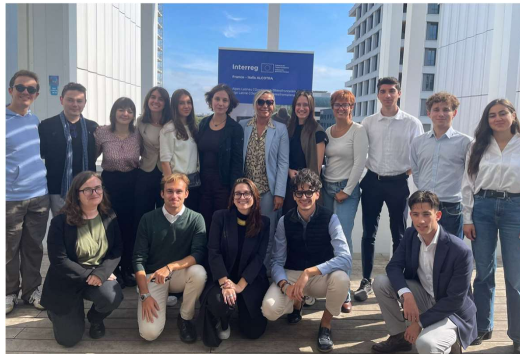
Les nouveaux membres du CDJ à Lyon pour une journée d'acculturation pour le lancement du mandat 2025-2026 (29-30 septembre 2025) | I nuovi membri del CDG a Lione per una giornata di acculturazione per il lancio del mandato 2025-2026 (29-30 settembre 2025)