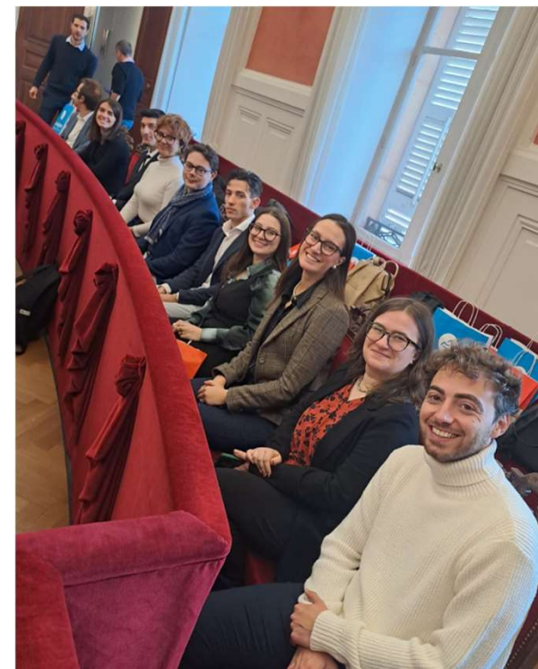
12-13.11.2025 : Comité de suivi à Chambéry

Il Consiglio dei giovani ALCOTRA ha un ruolo consultivo all'interno del Comitato di sorveglianza e ha la possibilità di elaborare proposte.