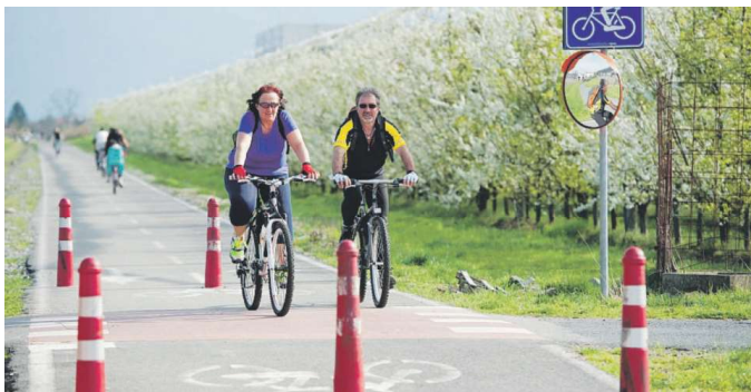
Gli operatori turistici del Pinerolese vedono di buon occhio l'idea di una ciclovia sulle rive del Chisone.

■ Migliorare la segnaletica dei sentieri e trasmettere un'immagine unitaria del territorio. Secondo gli operatori turistici delle valli del Pinerolese sono tra le esigenze più urgenti del settore. In quaranta, dalle Valli Susa, Chisone, Sangone, Germanasca, Pellice, lunedì 26 si sono incontrati su una piattaforma streaming per immaginare il turismo outdoor del dopo Covid. Di per sé è già una notizia: qualcosa si muove, e sono imprenditori e professionisti locali a volerlo. L'occasione è un percorso formativo organizzato dalla Regione grazie a Visit Piemonte e insieme alle AtL. Il primo appuntamento era in programma all'hotel Barrage Pinerolo; nei giorni successivi sono stati coinvolti gli operatori delle altre valli della provincia di Torino, poi l'Alta Langa e il Cuneese. Da novembre e fino ad aprile si svolgeranno quattro incontri al mese; si parlerà di marketing, di trend turistici, del valore del fare squadra, e si conosceranno case history di successo di Trentino e Svizzera. L'obiettivo è co-progettare lo sviluppo delle attività di bike e trekking. A partire dalle idee che vengono dal basso. Lunedì sera ne sono emerse alcune: