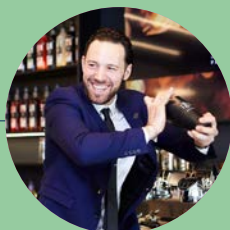
Par Mathias Cusset

Directement dans un verre type tumbler verser l'ensemble des ingrédients en terminant par l'eau de mélisse citronnelle gazéifiée puis mélanger à l'aide d'une cuillère à mélange. Garnir de plusieurs feuilles de mélisse citronnelle.