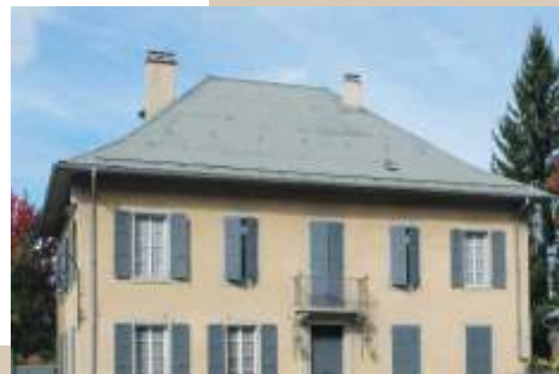
LA CURE - SAINT-GERVAIS