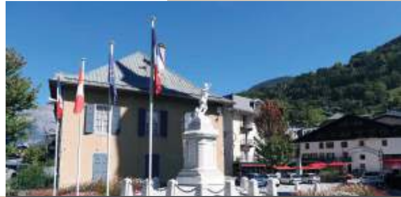
LA CURE - SAINT-GERVAIS