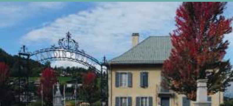
JARDIN PUBLIC - SAINT-GERVAIS

Permanences les lundis et vendredis : 14h30-16h30