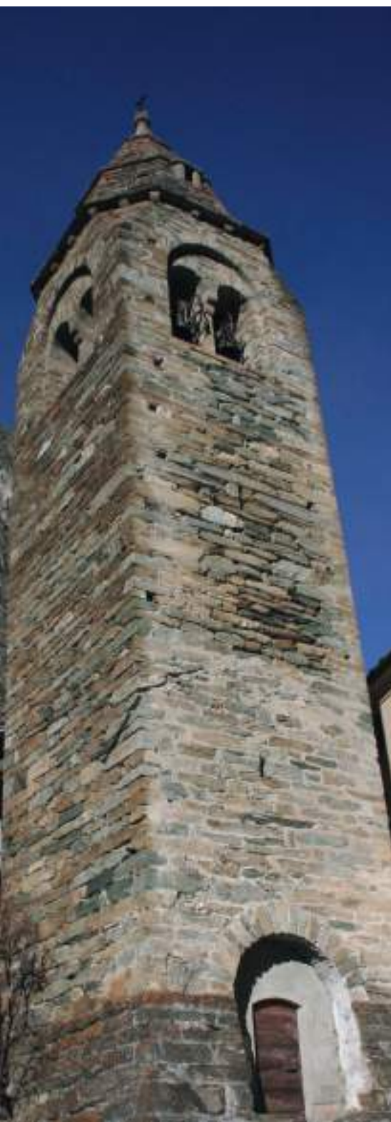
CAMPANILE DE VALGRISENCHÉ

Côté Valgrisenche , plusieurs travaux ont été finalisés (restauration des fresques de l'église, du clocher, de la chapelle de Ceré et de l'ancienne école de Bonne) en 24 mois pour un coût de : 645 100 €.