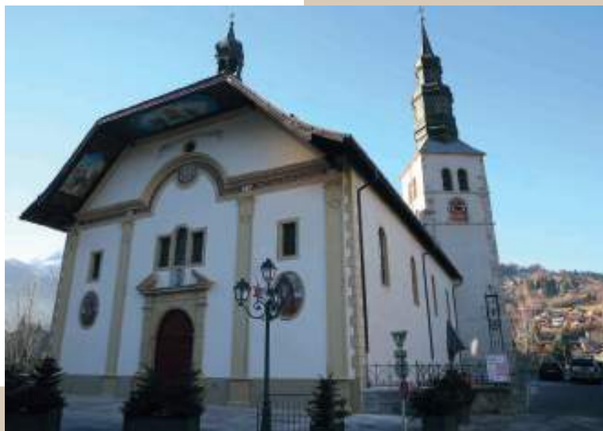
ÉGLISE DE SAINT-GERVAIS