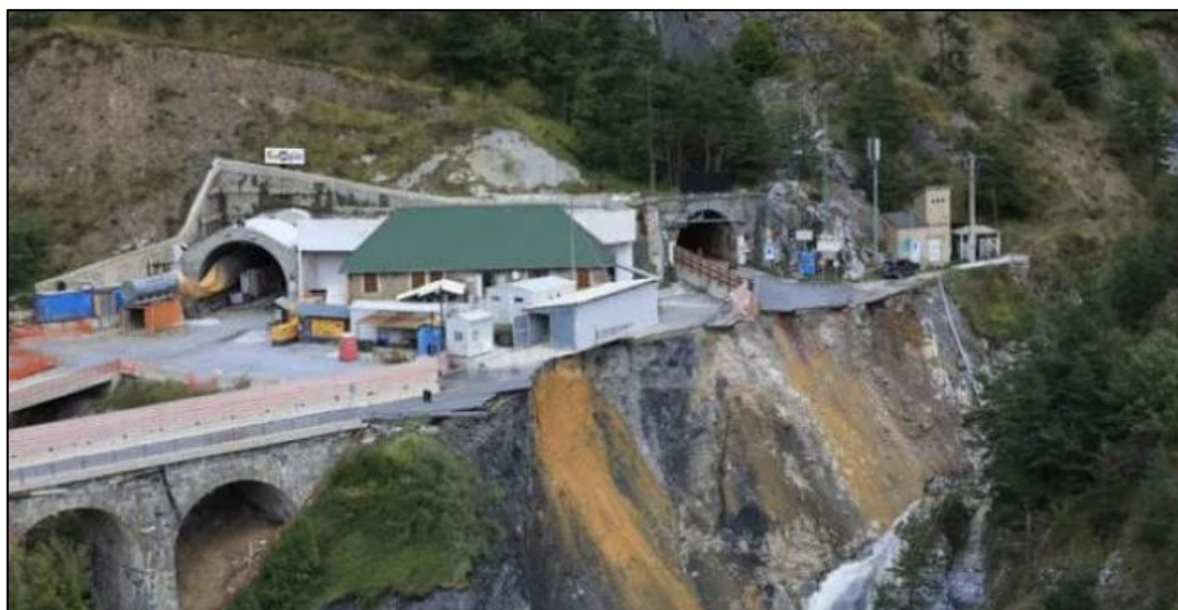
A la sortie du tunnel de Tenda, la route a été engloutie par un gouffre

Il y a eu immédiatement un isolement total à Triora et un isolement partiel à Airole et Olivetta San Michele tandis que des endroits comme Fontan, Saorge, Breil, Tenda et les environs étaient presque exclusivement accessibles par hélicoptère. Ce sont 35 kilomètres de route emportés par la furie des intempéries et la Roya, avec une dizaine de ponts emportés.