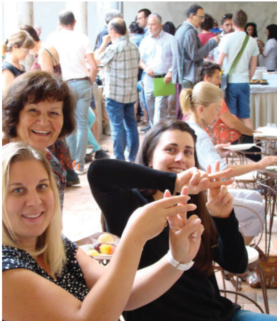
Séminaire de lancement - Saluzzo

Ce projet se réalise sur 30 mois à compter du 25 avril 2017. Nous espérons que ces actions soient pérennes après ce financement européen.