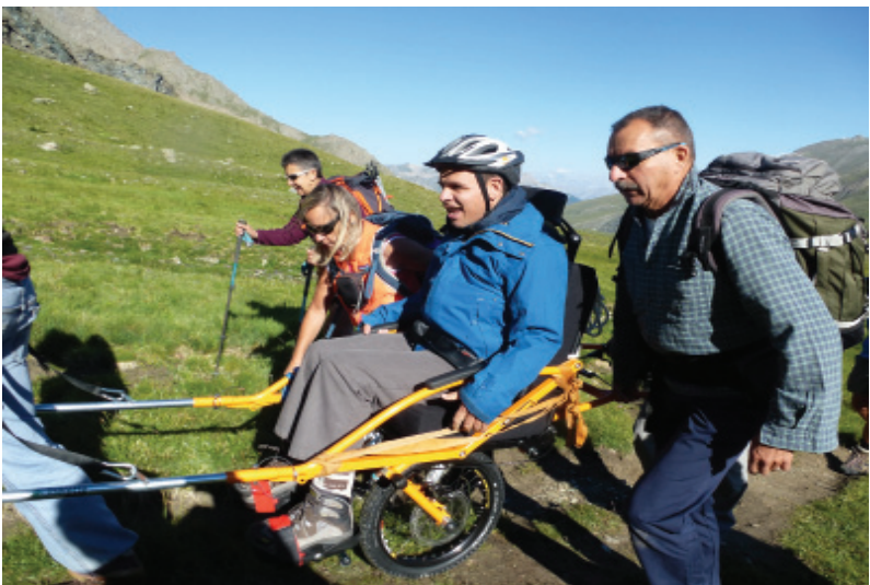
Le tour de la tête noire

Etonnés dans un premier temps mais très participatifs dans un second, Ils nous ont bien aidés à franchir des obstacles que nous n'avions pas repérés. Les premières aventures de nos engins sont plutôt encourageantes et la mobilisation engendrée nous satisfait pleinement. Ce matériel est destiné à être utilisé par le plus grand nombre. Nous sommes en discussion avec l'office du tourisme pour une mise à disposition la plus simple possible. Nous remercions l'hôpital local d'Aiguilles, partenaire du projet, qui nous offre l'espace nécessaire pour stocker ce matériel.