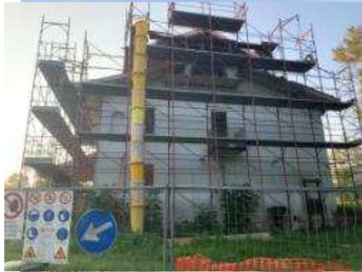
Cascina Rampa (Parco regionale La Mandria)