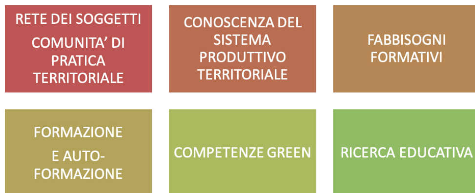
Fig. 2. Le 6 dimensioni del modello A.P.P. Ver.