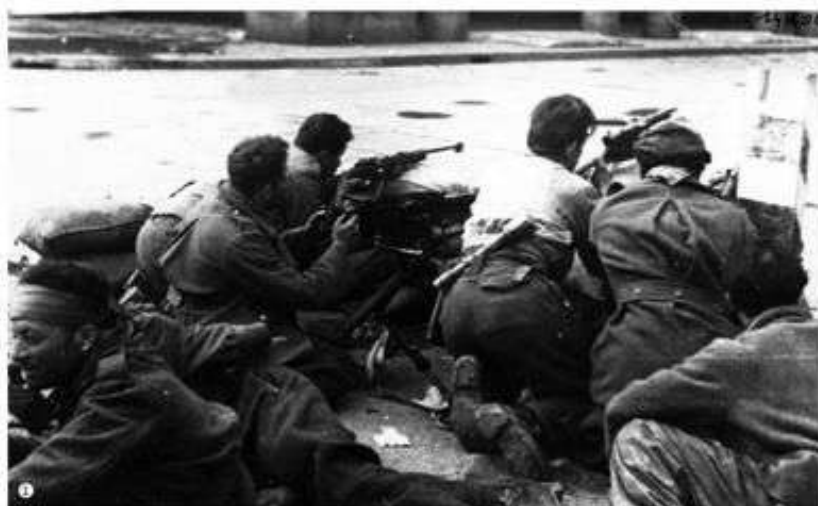
ISTITUTO DI RICERCA SULLA RESISTENZA DI CUNEO