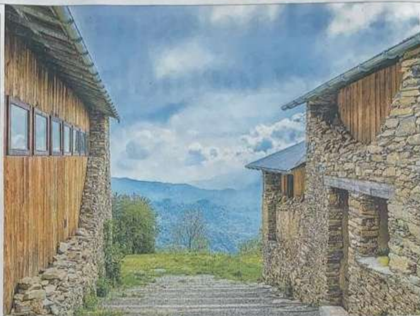
LA BORGATA DELLA VALLE STURA

Si parte da un periodo che si colloca tra la seconda metà dell'800 e la fine degli anni Trenta del '900, quando il mondo della montagna era ancora affollato, tra l'asprezza delle condizioni di vita degli abitanti e i lenti passaggi scanditi dalle migrazioni alpine. Dopo la parentesi della Resistenza, in cui compare un'intervista a Giorgio Bocca e si parla del coinvolgimento della popolazione, in particolare delle donne, si passa alla fase dello spopolamento delle Alpi quando, tra gli anni Cinquanta e Settanta, i contadini si spostano verso le fabbriche in città e diventano operai. L'ultima pagina è dedicata a chi ha deciso di fare rivivere la montagna. «Alcuni sono ritornati, altri resistono e guardano avanti: hanno portato la banda larga e cercano di moltiplicare le attività produttive attraverso la Scuola dei nuovi agricoltori di montagna e i contatti con