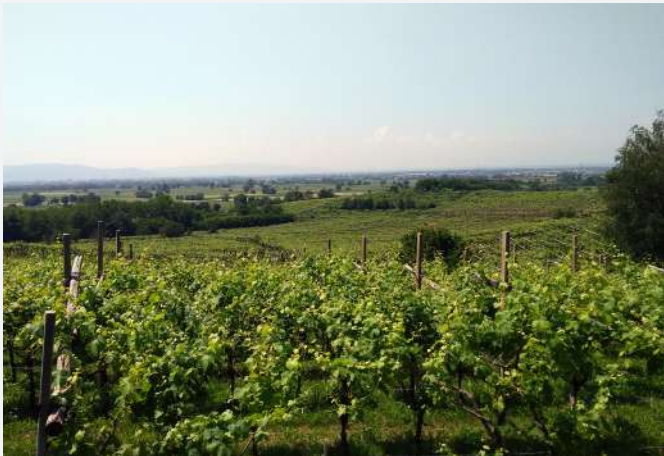
34 Vignes conduites à Treille à Caluso (TO) | Vigneti con impianto a Pergola a Caluso (TO).