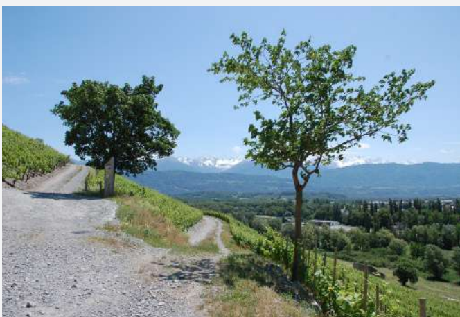
38 Plantation de fruitiers en bordure de chemins d'exploitation sur le coteau de Tormery, Chignin (Savoie) | Alberi da frutto lungo le strade poderali sul versante di Tormery, Chignin (Savoia).