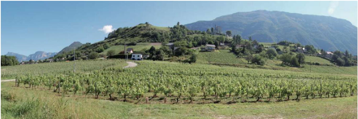
27 Les vignobles des coteaux des Tours et de Saint-Jeoire (Haute-Savoie) | I vigneti dei versanti di Tours e di Saint-Jeoire (Alta Savoia).