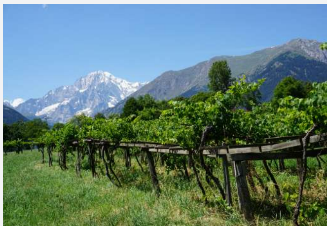
31 Vignes au pied du Mont Blanc. La Salle (AO) | Vigneti ai piedi del Monte Bianco. La Salle (AO).