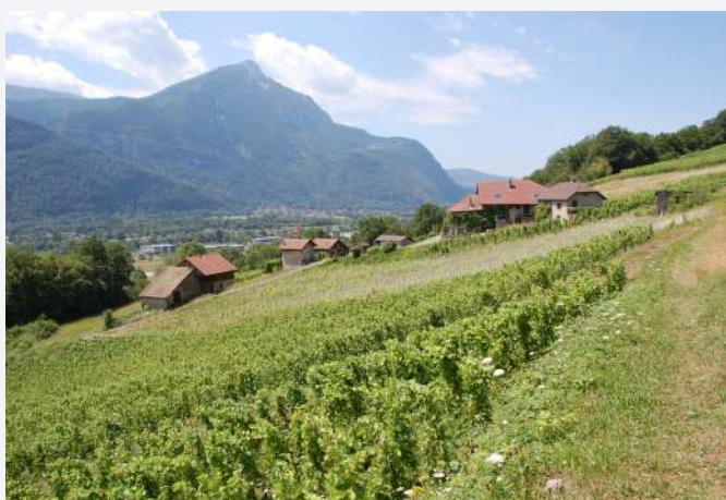
32 Le vignoble du Feu et son hameau. Marignier (Haute-Savoie) | Il vigneto di Feu e il suo borgo. Marignier (Alta-Savoia).