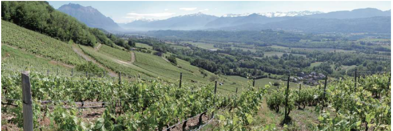
26 Les vignobles des coteaux d'Arbin et de Cruet (Savoie) | I vigneti dei versanti di Arbin e di Cruet (Savoia).