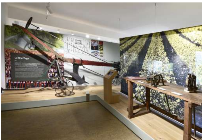
45 Le Musée Régional de la Vigne et du Vin, Montmélian (Savoie) | Il Museo Regionale della Vite e del Vino di Monmélian (Savoia).