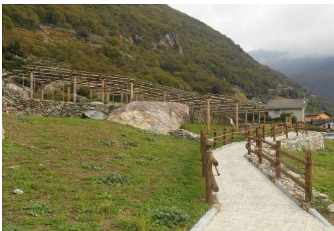
44 Le vignoble pilote à Donnas (AO) | Il vigneto dimostrativo a Donnas (AO).