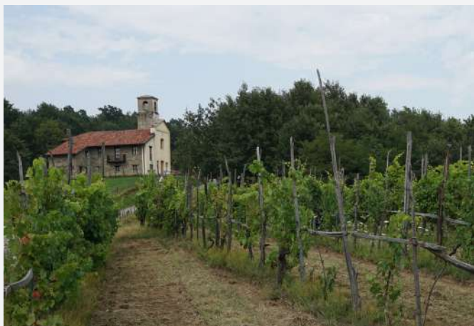
28 Vignes sur les coteaux de Bricherasio (TO) | Vigneti sulle colline di Bricherasio (TO).