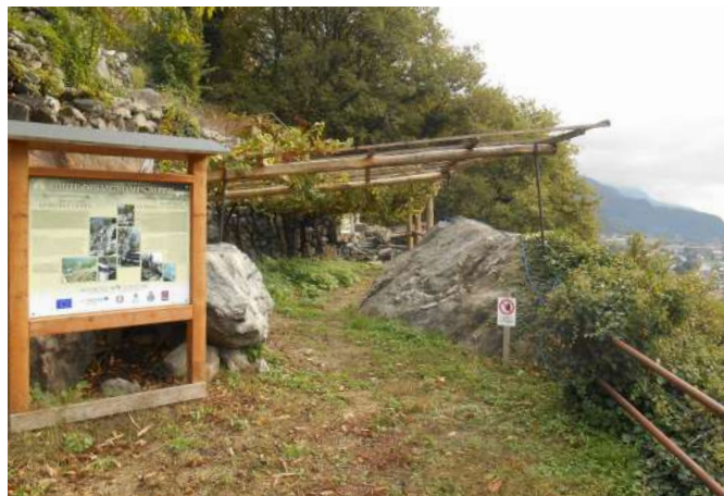
41 Le vignoble pilote à Donnas (AO) | Il vigneto dimostrativo a Donnas (AO).