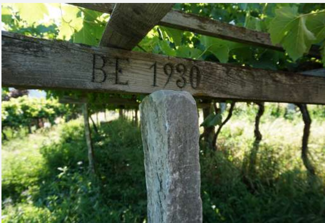
36 Gravure avec la date de réalisation du vignoble. Morgex (AO) | Incisione con la data di realizzazione del vigneto. Morgex (AO).