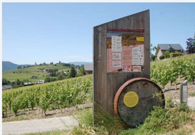
39 Borne-totem d'information pour la découverte du vignoble, Chignin (Savoie) | Pannello informativo per la scoperta del vigneto, Chignin (Savoia).