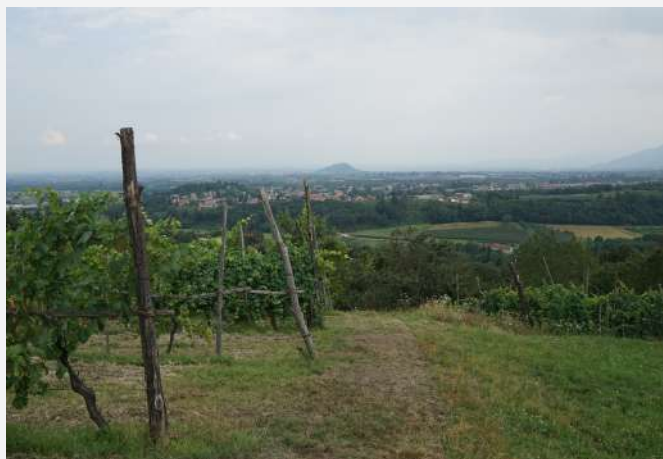
29 La vue depuis les vignes de Bricherasio (TO). Le sommet de la Rocca di Cavour en arrière-plan | La vista dai vigneti di Bricherasio (TO). Sullo sfondo, la Rocca di Cavour.