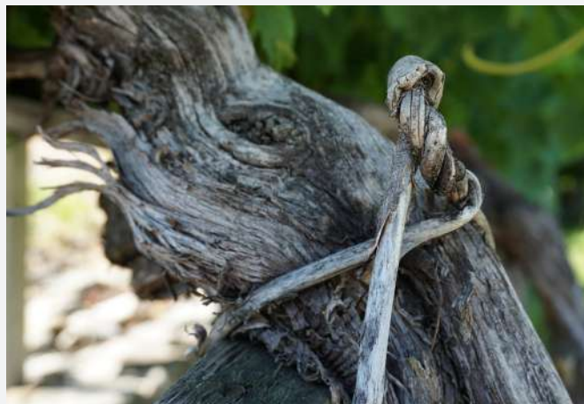
37 Pliage traditionnel avec le saule. Morgex (AO) | Legatura tradizionale con il salice. Morgex (AO).