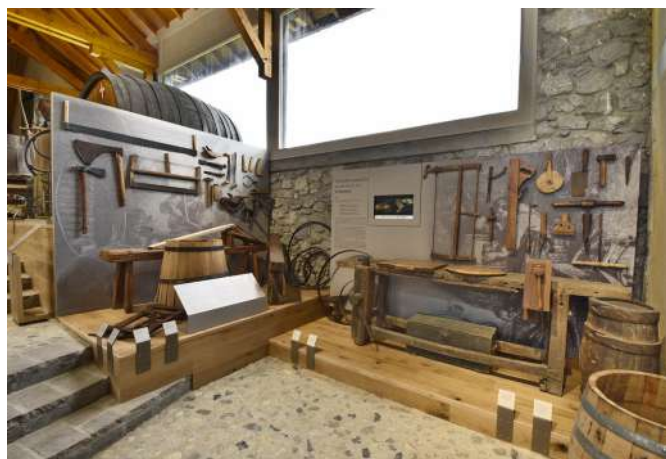
42 Le Musée Régional de la Vigne et du Vin, Montmélian (Savoie) | Il Museo Regionale della Vite e del Vino di Monmélian (Savoia).