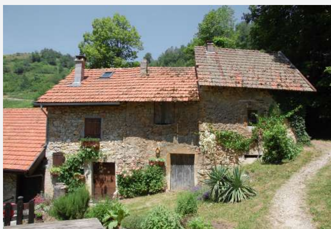
33 Bel ensemble de celliers restaurés, Saint-Jean-de-Chevelu (Savoie) | Bell'insieme di cantine ristrutturate, Saint-Jean-de-Chevelu (Savoie).