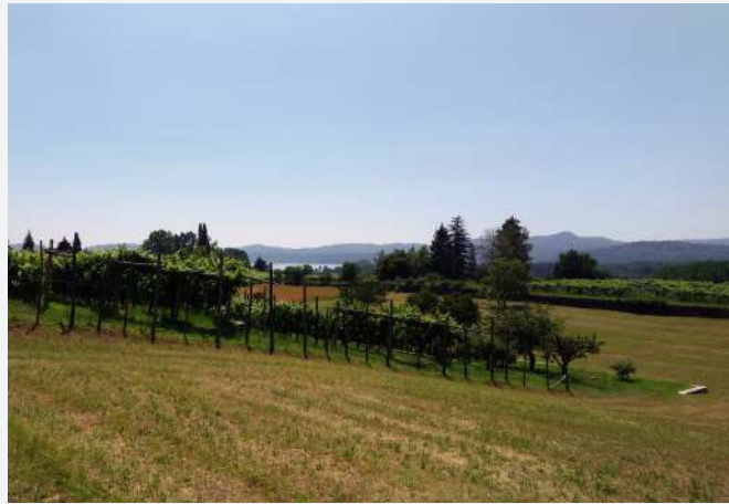
35 Vignes autour du Lac de Viverone. Piverone (TO) | I vigneti attorno al Lago di Viverone. Piverone (TO).