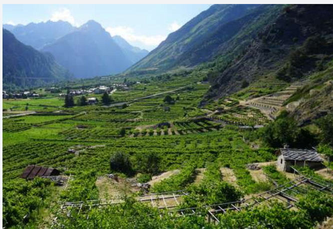
30 Vignes conduites à Treille Valdôtaine basse. Morgex (AO) | Vigneti allevati a Pergola Valdostana bassa. Morgex (AO).