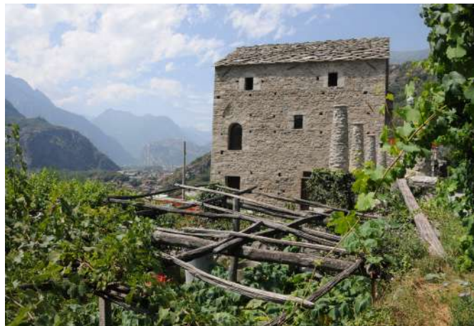
40 La maison forte Gran Masun à Carema (TO) | La casaforte Gran Masun a Carema (TO).