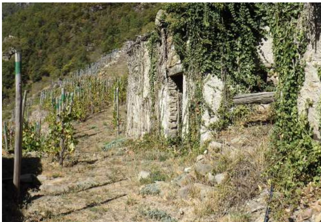
43 Les « ciabot » dans le vignoble pilote à Pomaretto (TO) | I "ciabòt" nel vigneto dimostrativo a Pomaretto (TO).